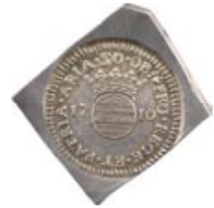
Vente sur Offres iNumis 27 n° 2709 : Louis XIV, siège d'Aire-sur-la-Lys, 50 sols, 1710

Dans les faits, malgré cette distinction, on a pris l'habitude depuis le XIX e siècle d'utiliser l'expression « monnaies obsidionales et de nécessité » pour les fabrications que Duby appelle « pièces ».