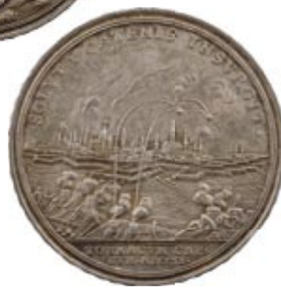
Delorme et Collin du Bocage, 20 mai 2010 n° 181 : Louis XIV, médaille du siège et prise de Lille en 1708