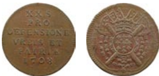
Vente sur Offres iNumis 17 n° 612 : Louis XIV, siège de Lille, XX sols, 1708 Lille

• Félix BESSY-JOURNET, Essai sur les monnaies françaises du règne de Louis XIV , Chalon-sur-Saône, 1850. Cet ouvrage, qui reste toujours valable, répertorie les monnaies obsidionales (Landau, Aire-sur-la-Lys, Lille, Tournai, etc.) et aussi les monnaies de nécessité de la foire de Beaucaire.