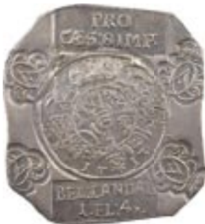
Delorme et Collin du Bocage, 6 décembre 2016, n° 167 : Allemagne, Landau (siège de), Charles-Alexandre de Wurtemberg, 1 florin 4 kreuzers, 1713 Landau

En raison de leurs liens très étroits avec des événements historiques, les monnaies obsidionales furent souvent appelées au XIX e siècle « monnaies historiques » par de grands numismates : Félicien de Saulcy, Émile Cartier (fondateur de la Revue Numismatique ), Anatole de Barthélémy (conservateur du Cabinet des Médailles), etc. Cette appellation est justifiée car les monnaies obsidionales sont souvent au cœur d'événements historiques de première importance.