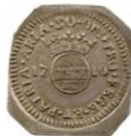
Vente sur Offres iNumis 17 n° 613 : Louis XIV, siège d'Aire-sur-la-Lys, 50 sols, 1710