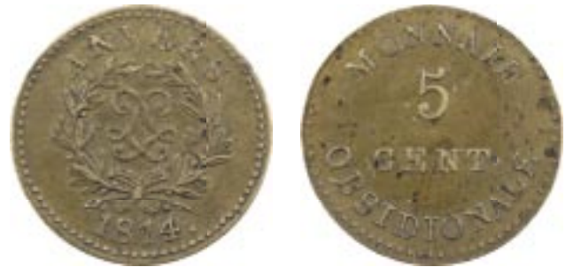
Vente sur Offres iNumis 30 n° 861 : Louis XVIII, siège d'Anvers, 5 centimes, 1814 Anvers

Jusqu'en 2015, l'ouvrage de référence pour les monnaies obsidionales et de nécessité était celui du lieutenant-colonel belge Prosper Maillet, Monnaies obsidionales et de nécessité , paru à Bruxelles en 1868-1870 et réédité dans les années 1970 en Italie (Forni). On peut encore le trouver d'occasion, notamment chez iNumis . Cet ouvrage peut être complété par la collection personnelle très complète du colonel et avec des inédits manquant à l'ouvrage, vendue à Paris en 1886 par Van Peteghem.